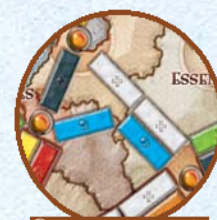
Этот маршрут двойным не является

Обратите внимание на маршруты, лишь частично идущие вместе – они соединяют разные города, и двойными не являются.